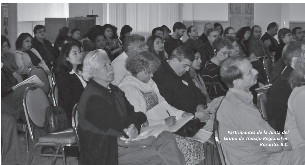
Participantes de la Junta del Grupo de Trabajo Regional en Rosarito, B.C.