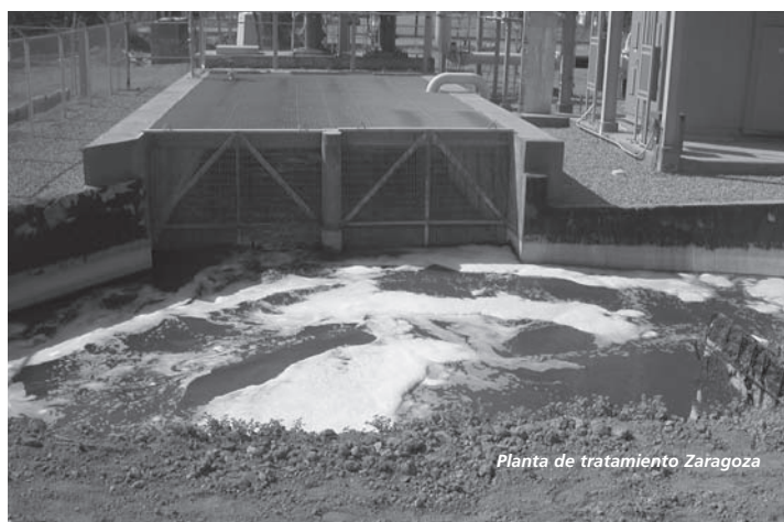
Planta de tratamiento Zaragoza

La certificación del nuevo proyecto, con la reubicación de la planta de tratamiento de aguas residuales de Mexicali II, es un testimonio del esfuerzo que la CESP ha hecho para trabajar con el grupo de agencias interesadas en ambos lados de la frontera para resolver un problema ambiental de bastante tiempo. ■