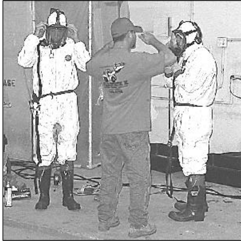
Trabajadores vestidos en trajes protectivos para materiales peligrosos y con respiradores se preparan para quitar la tierra y el concreto contaminado del interior de la instalación clausurada de Master Plating.